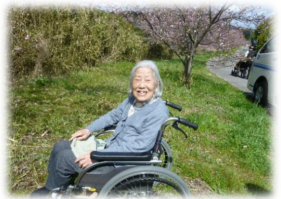
記入者 中村 紘士

施設での生活にも少しずつ慣れてきたようです。食事や入浴など直前のことは忘れてしまいますが昔のことなどはお話ししてくれます。フロアで近くの席の方達とお話しされながら新聞たたみのお手伝いをしてくれたり洗濯物をたたんでくれます。先日は梅、桜のお花見にお出掛けされ楽しまれてみえました。