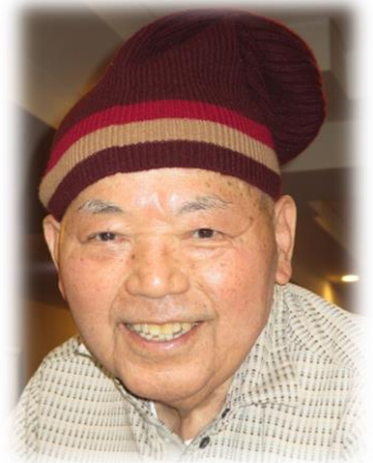
記入者 原田 とみ子

暖かくなり風邪を引かれる回数も減って見えますが、健康面にはとても気を付けて過ごされて見えます。毎朝元気良く挨拶して下さい、職員も元気を頂いております。