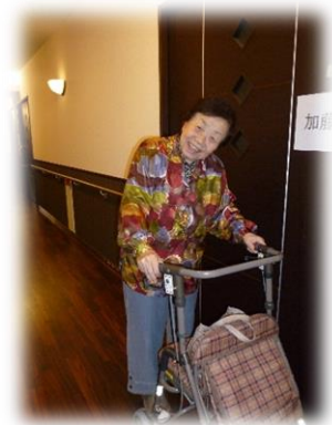
記入者 新町 和雄

食事前後やおやつの時間は他の利用者と笑顔で良く話しをされています。 日曜日の果物販売の日を楽しみにしている様子です。 お姉様がショートステイを利用される時には、ご自分の居室で一緒に過ごされています。