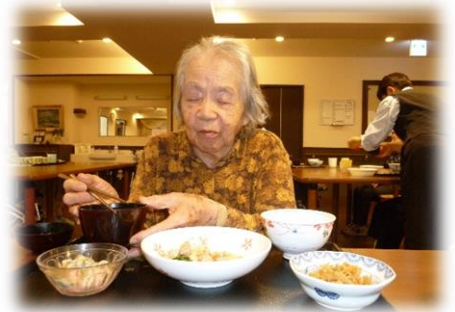
記入者 杉浦 金子

デイサービスには休まれずに行かれています。日中は居室で休まれていることが多く、声掛けしフロアで過ごして頂けるように心掛けています。食事、おやつの中には、ご自分でフロアに出てきて下さいます。