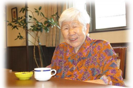
記入者 中村 紘士

花草木の水やり、新聞を読まれ、2階と1階玄関先を何度か行き来され、入浴後は氷水を飲まれ、日課は崩されることなく過ごされてみえます。新しい下着(リハパン)の受け入れは、なかなか困難な状況ですが、女性スタッフが中心となり快適な生活をしていただけるよう、支援させていただいております。