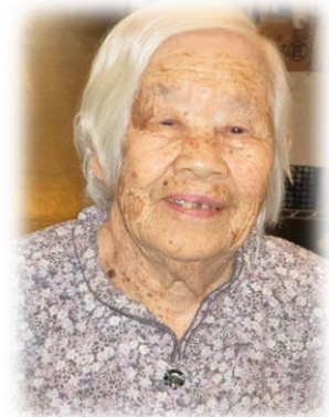
記入者 浅野 貴司

居室で過ごされていることが多いですが、入浴の為にヘルパーと楽しそうに話をしながら浴室に向かう姿をよく見かけまし、食後には他の利用者の方と居室前でまるで井戸端会議のように話し込んでいたりもしています。また、普段の会話から人の役に立つことがあればしてあげたいとの気持ちが強い方だと感じられ、実際お手伝いをお願いするといつも快く引き受けて下さりとても助かっています。