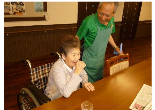
記入者 柴田 彦乃

施設での生活にも慣れて職員の名前も覚えて頂きお話しもよくして下さいます。お部屋で食事を召し上がる事が多いですがおやつなどフロアに出てこられて他の入居者様とお話しされていることもあります。体調面では不安定なところがあり頭痛や生き苦しいなどの訴えがよくあります。訴えに耳を傾け安心して生活して頂けるように援助を行って参ります。