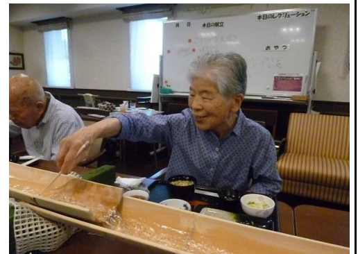
記入者 浅野 貴司

夏の間は暑くならないうちにと朝早く散歩に出かけてられています。その後はフロアで他の入居者と一緒にテレビ体操を毎日されており、健康でいたいとの思いがこちらにも伝わってきます。また、職員や他の入居者に対し、御自分の方から笑顔で声を掛けておられる姿をよくみかけ、少しでもコミュニケーションを取ろうとされているようです。